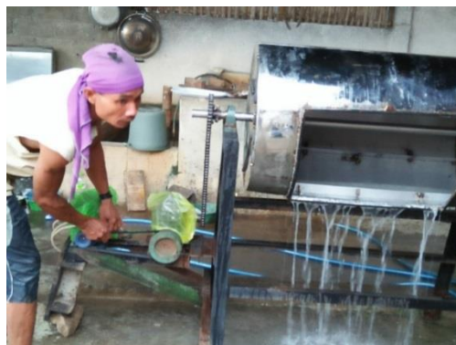
Gambar 1 Display Pengaduk Bumbu Krecek Rambak

Pada identifikasi potensi bahaya menggunakan Hazard And Operability Study (HAZOP) maka penerapan dan pemahaman Keselamatan dan Kesehatan Kerja (K3) di UMKM Eka Jaya perlu dilakukan agar lebih aman dan tidak terjadi kerugian material maupun pekerja.