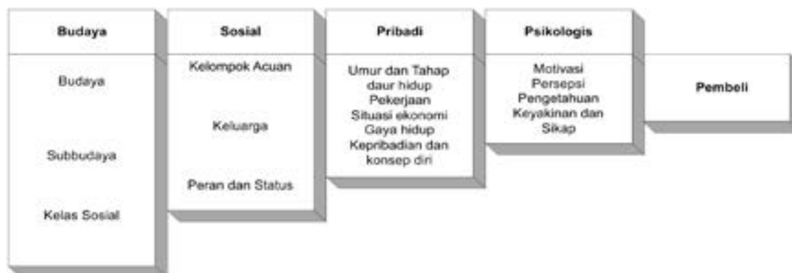
Gambar 1 : Faktor-Faktor Yang Mempengaruhi Tingkah Laku Konsumen

Faktor-faktor yang mempengaruhi perilaku konsumen adalah kebudayaan, faktor sosial, pribadi, psikologis. Sebagian faktor-faktor tersebut tidak diperhatikan oleh pemasar tetapi sebenarnya harus diperhitungkan untuk mengetahui seberapa jauh faktor-faktor perilaku konsumen tersebut mempengaruhi pembelian konsumen.