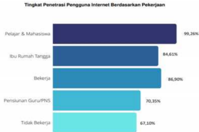
Gambar 1. Tingkat Penetrasi Pengguna Internet Di Indonesia