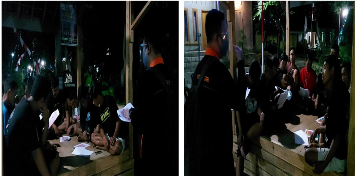
Gambar 2. Penyuluhan penggunaan masker dan mencuci masker