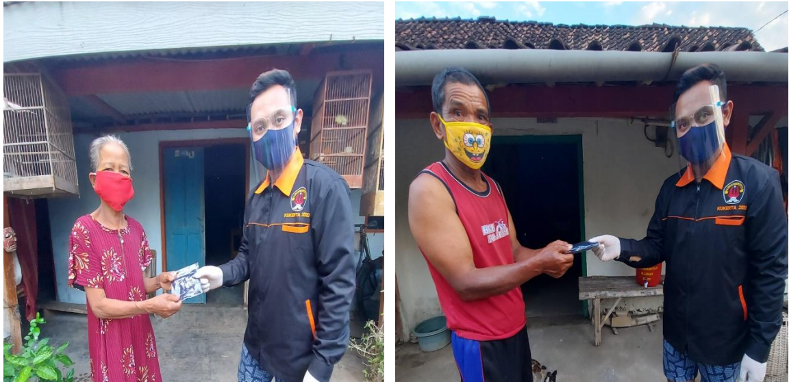
Gambar 3. Pelatihan pembagian masker gratis dan penggunaan masker