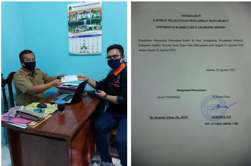
Gambar 1. Proses pengurusan perijinan

Pada tanggal 10 Agustus 2020 melakukan observasi ke lokasi PENGMAS. Tim PENGMAS menuju kantor kepala desa untuk menemui Kepala Desa Jerukgulung untuk mengurus surat perijinan PENGMAS dan juga diskusi untuk program pelatihan penggunaan dan mencuci masker serta pembagian masker gratis. Kegiatan PENGMAS ini ditujukan kepada masyarakat Desa Jerukgulung, Kecamatan Balerejo, Kabupaten Madiun.