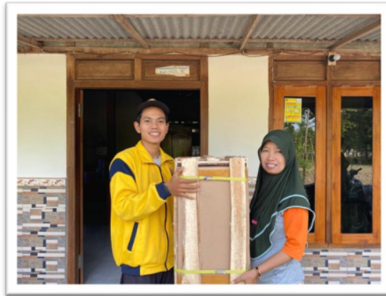
Gambar 1. Pemberian Mesin Peniris Minyak Kepada UMKM Sikeyyan

Permasalahan lain yang teridentifikasi yaitu produk keripik usus dijual menggunakan kemasan sederhana. Pemilik melakukan proses produksi dan pemasaran secara konvensional karena keterbatasan ilmu pengetahuan dan kemampuan mengakses informasi. Padahal, produk keripik usus bisa menjangkau pasar yang lebih luas jika ditingkatkan segi pengemasan dan pelabelan. Pemberian label yang lengkap juga bagian dari proses pemenuhan hak konsumen untuk mendapatkan informasi yang benar, jelas, dan jujur dari produk yang akan dikonsumsi. Label tersebut berisi antara lain: nama produk, merek, produsen, alamat produsen, komposisi, berat bersih, dan tanggal kadaluarsa. Kami membuat inovasi untuk membantu UMKM mitra sasaran untuk meningkatkan kuantitas dan kualitas produk, serta membantu pelatihan dan pendampingan pemasaran berbasis IT.