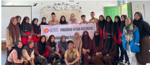
Gambar 4. Foto bersama pemateri dan peserta kegiatan pengabdian pada masyarakat di Madrasah Aliyah DDI Lonja Kabupaten Sigi.

Disiplin seseorang dalam dalam berkendara dipengaruhi oleh faktor internal dan faktor eksternal. Faktor internal meliputi dorongan dalam diri yang muncul dalam diri seseorang untuk menaati peraturan lalu lintas, sedangkan faktor eksternalnya meliputi tekanan untuk seseorang untuk dapat menaati peraturan lalu lintas. Kewajiban yang harus dilakukan oleh setiap warga negara yang baik adalah menaati hukum. Dalam hal ini, pemuda itu adalah salah satu warga negara ini. Anak muda dapat dikatakan sebagai warga negara yang baik apabila dapat menegakkan kepatuhan terhadap ketentuan undang-undang. Jika remaja mematuhi peraturan lalu lintas, mereka dapat dikatakan sebagai warga negara yang baik. Pasalnya, remaja telah membantu mewujudkan kenyamanan setiap warga negara, terutama dalam hal kemudahan dalam berlalu lintas (Winahyu & Sumaryati, 2013).