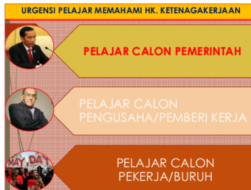
Gambar 2. Salah satu slide materi pemahaman tentang ketenagakerjaan kegiatan pengabdian di SMKN 7 Palu

dengan menerima upah atau imbalan dalam bentuk lain. Pekerja atau buruh merupakan bagian dari tenaga kerja yaitu tenaga kerja yang bekerja didalam hubungan kerja, dibawah perintah pemberi kerja (Maimun, 2004). Dalam Pasal 1 ayat 4 Undang-Undang Nomor 13 Tahun 2003 tentang Ketenagakerjaan dijelaskan bahwa Pemberi Kerja adalah orang perseorangan, pengusaha, badan hukum, atau badan-badan lainnya yang mempekerjakan tenaga kerja dengan membayar upah atau imbalan dalam bentuk lain. Pekerja memiliki sedikit perbedaan dengan tenaga kerja. Tenaga kerja adalah setiap orang yang melakukan pekerjaan, termasuk didalamnya bekerja pada sektor formal, misalnya wiraswasta atau pedagang yang bekerja untuk dirinya sendiri maupun orang lain sedangkan pekerja adalah mengarah pada bekerja untuk orang lain yang mendapatkan upah atau imbalan lain (Agusmidah, 2010). Jadi, berdasarkan uraian diatas dapat disimpulkan bahwa pekerja merupakan orang yang bekerja pada orang lain atau pemberi kerja yang berupa orang perseorangan, pengusaha, badan hukum atau badan-badan lainnya untuk mendapatkan imbalan.