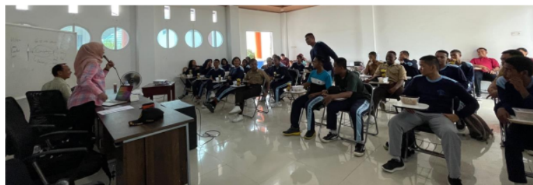
Gambar 4. Tim pengabdian memberikan apresiasi kepada peserta yang antusias dalam pemaparan pemahaman hukum ketenagakerjaan pada kegiatan pengabdian di SMKN 7 Palu

Menurut Undang-Undang Nomor 13 Tahun 2013 Tentang Ketenagakerjaan mendefinisikan ketenagakerjaan adalah segala hal yang berhubungan dengan tenaga kerja pada waktu sebelum, selama, dan sesudah masa kerja. Perlindungan hukum dari kekuasaan pengusaha/majikan terlaksana apabila peraturan perundang-undangan dalam bidang perburuhan yang mengharuskan atau memaksa majikan bertindak seperti dalam perundang-undangan tersebut benar-benar dilaksanakan semua pihak, karena keberlakuan hukum tidak dapat diukur secara yuridis saja, tetapi diukur secara sosiologis dan filosofis (Wahab et al., 1997).