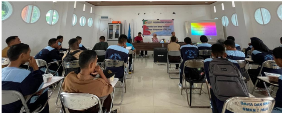
Gambar 1. Penyaji sedang menjelaskan pemahaman tentang ketenagakerjaan di SMKN 7 Palu.

Pada kegiatan pengabdian dilaksanakan di SMKN 7 Palu dihadiri 40 peserta yang berasal dari kelas 12 dan beberapa guru kelas. Penyaji memaparkan materi terkait hukum ketenagakerjaan mulai dari esensi hubungan kerja, pemutusan hubungan kerja dan perlindungan hukumnya. Hal yang terutama untuk menerapkan pelaksanaan safety yakni memahami betapa pentingnya tingkat pelaksanaan tahapan prosedur yang aman. Peningkatan kerja juga cenderung akan merasa akan baik baik saja tanpa memakai helm, dikarenakan sudah bertahun tahun tidak mengalami kecelakaan, akan tetapi kecelakaan kerja akan mengenai siapa saja yang tidak dikehendaki dan secara tiba-tiba. Hal itu dikarenakan dalam setiap tindakannya, sedangkan umumnya akan merasa akan baik baik saja dan lalai meremehkan hal yang akan terjadi (Susanto et al., 2022).