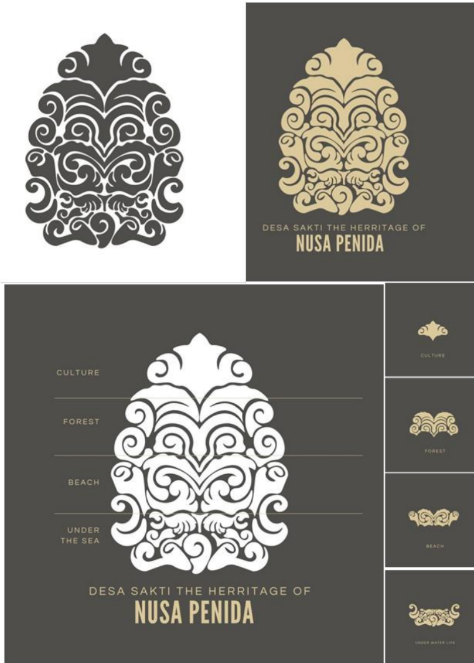
Gambar 4. Logo Desa Sakti