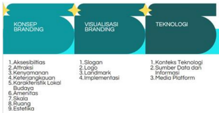
Gambar 1. Metode Pelaksanaan Konsep Branding Desa Sakti

Dalam penentuan branding DTW Gamat Bay berikut adalah ilustrasi metode yang digunakan untuk menentukan destination branding yang tepat. Metode ini melibatkan kolaborasi unsur keilmuan Arsitektur dan IT untuk melengkapi aspek perancangan arsitektur yang berhubungan dengan konsep branding dengan pemanfaatan teknologi.