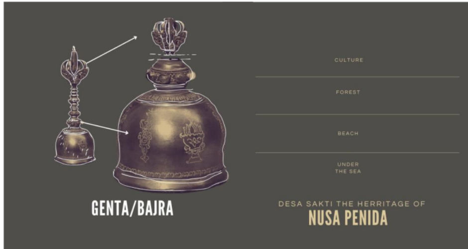
Gambar 3. Konsep yang Melandasi Visualisasi Logo

Konsep Genta diterjemahkan sebagai bentuk dasar visual logo dari Desa Sakti, genta dapat berarti landasan filosofis terhadap sejarah Desa Sakti. Dengan menjabarkan potensi Desa Sakti seperti gambar diatas, maka visual akan mengandung jenis karakteristik dan potensi desa. berikut adalah hasil turunan konsep yang ditunjukkan pada gambar berikut: