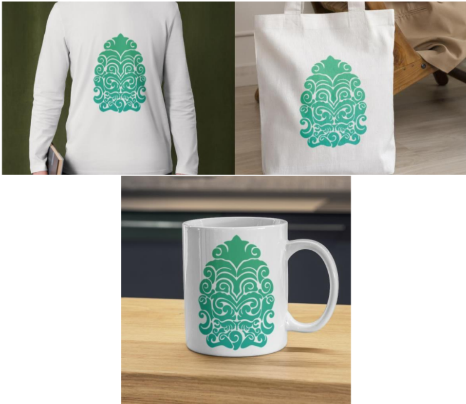
Gambar 5. Implementasi Logo pada Produk

Implementasi visual konsep branding logo dapat digunakan sebagai branding produk maupun keyvisual sekaligus memberikan efek promosi Desa Sakti bagi wisatawan maupun khalayak ramai. Sehingga kedepannya usaha Desa Sakti dalam penyediaan cinderamata juga dapat memberikan identitas dalam wujud logo untuk melengkapi branding Desa Sakti sebagai Desa Heritage. Berikut adalah konsep implementasi visualisasi konsep branding Logo pada gambar dibawah ini.