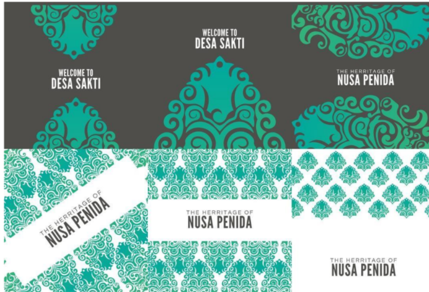
Gambar 5. Implementasi Logo sebagai Key Visual dalam Digital Branding