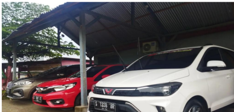
Gambar 1 Usaha Travel Nafis Transport

Berdasarkan hasil survei dan pengamatan mendalam yang dilakukan pada usaha travel Nafis Transpot tentang pengetahuannya mengenai sistem operasional usaha dapat disimpulkan pada tabel berikut: