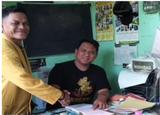
Gambar 2 Hasil Dokumentasi Pada Objek Dampingan

Berdasarkan hasil diskusi dan wawancara mendalam pada tahapan persiapan yang dilakukan terhadap "Nafis Transport" secara khusus difokuskan pada perbaikan SOP di dua aspek utama, yaitu pelayanan pelanggan dan manajemen armada. Hal ini dapat dijelaskan bahwa dalam rangka meningkatkan kualitas layanan, pendampingan ini akan memberikan perhatian khusus terhadap proses dan langkah-langkah yang terlibat dalam memberikan pelayanan yang efisien dan berkualitas kepada pelanggan. Selain itu, aspek manajemen armada menjadi sorotan penting, dengan tujuan untuk meningkatkan efisiensi operasional, pemeliharaan armada, dan keamanan selama perjalanan. Melalui pendampingan ini, diharapkan SOP yang diperbarui tidak hanya akan meningkatkan kepuasan pelanggan tetapi juga memperkuat manajemen operasional secara keseluruhan, membantu "Nafis Transport" menjadi lebih kompetitif dan berkelanjutan dalam industri perjalanan.