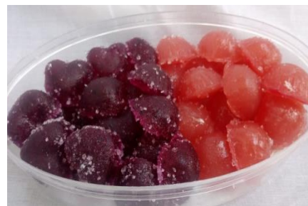
Permen Jelly Buah Naga