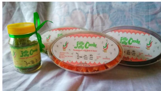
Gambar 5: Kemasan Permen Jelly Setelah Program PKM