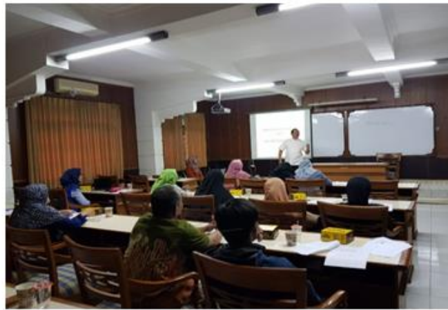
Gambar 6: Pelatihan Internet Marketing, Pelatihan Manajemen UMKM dan Pelatihan Akuntansi