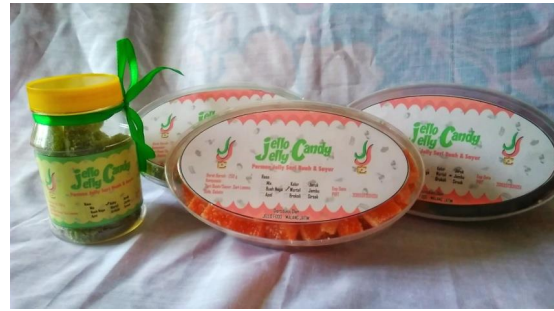
Permen Jelly Setelah di Packing