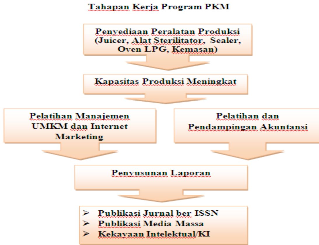
Gambar 2: Metode Pelaksanaan