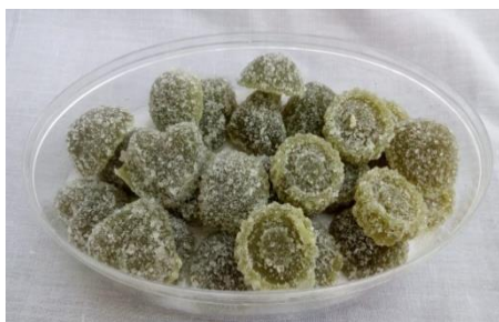
Permen Jelly Apel