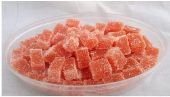
Permen Jelly Wortel