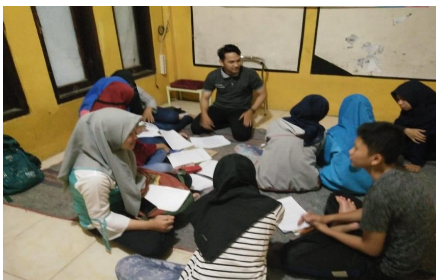
Gambar 5. Guru LKP Excellent Course mengajar dengan menggunakan aplikasi Let's Read