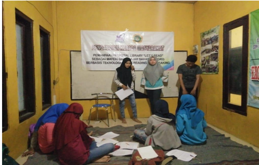
Gambar 6. Siswa mencoba bercerita dengan menggunakan aplikasi Let's Read