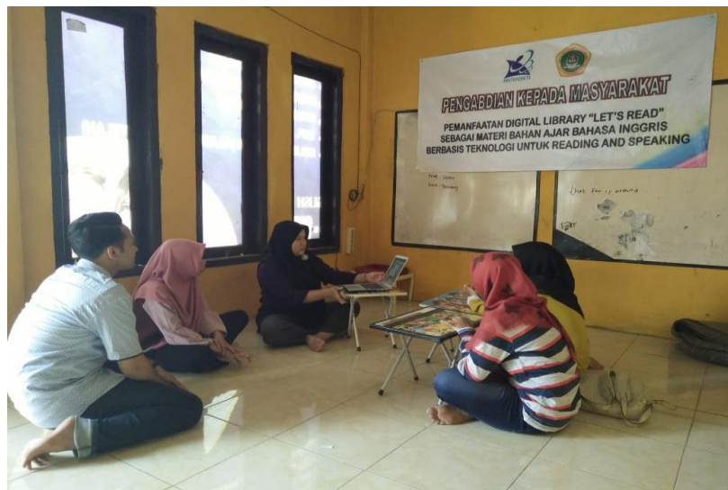
Gambar 3. Peneliti masih menjelaskan macam-macam cerita yang ada dalam Let's Read Application

Berikutnya adalah dilakukan simulasi mengajar dengan menggunakan aplikasi tersebut dan hal tersebut menjadi bahan evaluasi dan refleksi. Beberapa hal yang perlu mendapatkan perhatian adalah adanya keterbatasan koneksi internet yang sangat mendukung pembelajaran berlangsung ketika hal itu terpenuhi dengan baik. Kemudian hal yang lain adalah jenis cerita yang agak sedikit berbeda dengan cerita yang biasanya anak-anak terima dikelas, maka hal itu menjadi tantangan tersendiri untuk pengajar tuntaskan karena pengajar disini juga dituntu untuk dapat menggunakan ICT yang bisa menstimulasi peserta didik untuk mendukung strategi belajarnya (Ghasemi & Hashemi, 2011). Hal-hal yang telah disebutkan diatas dapat dilihat melalui gambar-gambar dibawah ini.