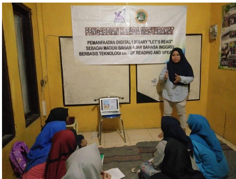
Gambar 4. Peneliti memberikan pengarahan pembuka sebelum aplikasi Let's Read digunakan