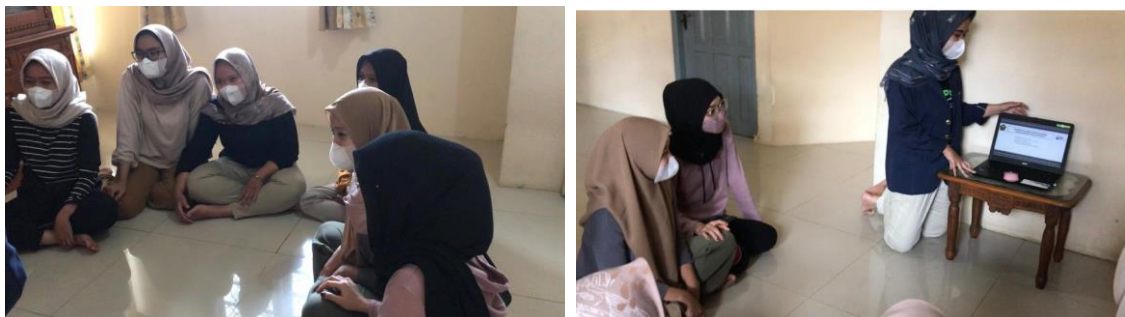
Gambar 1. Kegiatan Sosialisasi dan Edukasi

Pada kegiatan sosialisasi ini dilaksanakan dengan tujuan membuka wawasan dalam menciptakan sebuah usaha dengan memperkenalkan produk makanan Rice Bowl kepada remaja setempat untuk memotivasi dan meningkatkan daya minat wirausaha para remaja dalam memanfaatkan peluang yang ada. Peserta sangat bersemangat dan antusias pada program kegiatan yang dilaksanakan.