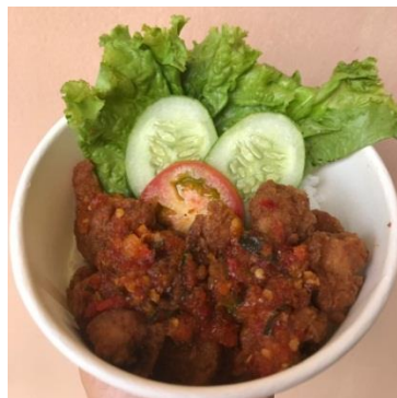
Gambar 7. Varian Menu Rasa Nasi Ayam Crispy Sambal Korek