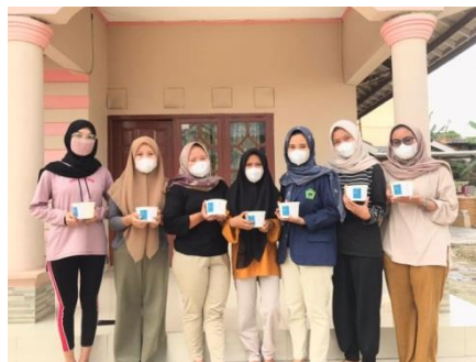
Gambar 11. Evaluasi Bersama Peserta

Evaluasi program pelatihan menciptakan usaha Rice Bowl memberikan dampak positif kepada para peserta yaitu peningkatan ekonomi, motivasi, dan pengetahuan para remaja serta penerapan lanjut dari kegiatan yang telah dilaksanakan. Hal ini dapat dilihat dari peningkatan kemampuan para peserta dalam menciptakan suatu usaha dibidang makanan dengan mempertahankan rasa dan meningkatkan penjualan di social media yang memperhatikan kata-kata dalam promosi produk, pengambilan foto produk yang menarik dan sticker untuk kemasan yang di desain lebih baik.