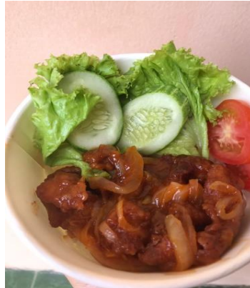
Gambar 6. Varian Menu Rasa Nasi Ayam Crispy Asam Manis