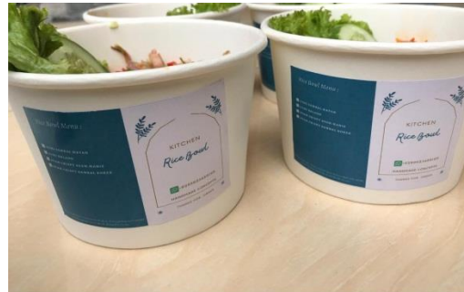
Gambar 8. Hasil kegiatan packaging

pengemasan produk juga harus memperhatikan tampilan makanan agar terlihat menarik dengan kualitas packaging yang baik.