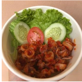
Gambar 5. Varian Menu Rasa Nasi Cumi Sambal Balado