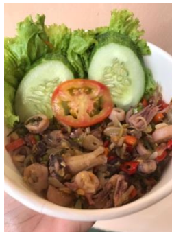
Gambar 4. Varian Menu Rasa Nasi Cumi Sambal Matah