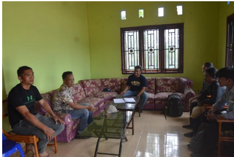
Gambar 3. Pertemuan awal Kepala Desa dengan tim penyuluh UHO

Peran konservasi tanah dan air bagi pekebun kelapa sawit sangatlah penting untuk menjaga keberlanjutan lingkungan, meningkatkan produktivitas lahan, serta meminimalkan dampak negatif terhadap ekosistem. Berikut kegiatan sosialisasi terkait peran konservasi tanah air di Desa Wawolemo disajikan pada Gambar 3, 4, dan Gambar 5.