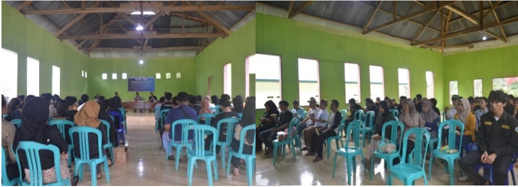
Gambar 5. Penyuluhan Peran Konservasi Tanah dan Air Bagi Pekebun Kelapa Sawit Rakyat di Desa Wawolemo

Selain mekanisme sistem perakaran dan kanopi, pemahaman terkait standar pengelolaan perkebunan yang baik juga dapat berfungsi sama yaitu dalam mengkonservasi air dan tanah pada kebun sawit. Standar tata kelola kebun sawit seperti penanaman cover crop , teras-sering, rorak, penataan pelepah sebagai guludan, pengembalian tankos dan limbah cair seluruhnya berbasis konservasi tanah dan air (Paspi, 2021; Satriawan et al. , 2021). Selain itu, upaya-upaya lain yang menurut Mahmud (2023) selain sebagai tindakan konservasi juga berkontribusi pada kesuburan tanah seperti penanaman pohon campuran dengan sawit, penanaman sawit berbasis olah tanah konservasi, permukaan lahan dibiarkan bergelombang, pemulsaan menggunakan limbah sawit juga perlu terus diupayakan penerapannya terutama oleh pekebun sawit rakyat yang modalnya relatif terbatas seperti petani di Desa Wawolemo.