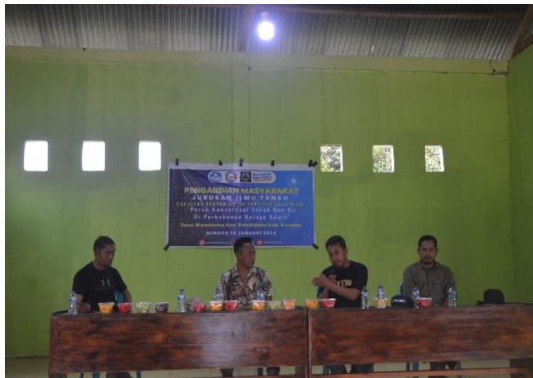
Gambar 4. Tim Penyuluh UHO Memberikan Sosialisasi Peran Konservasi Tanah dan Air Bagi Pekebun Kelapa Sawit Rakyat