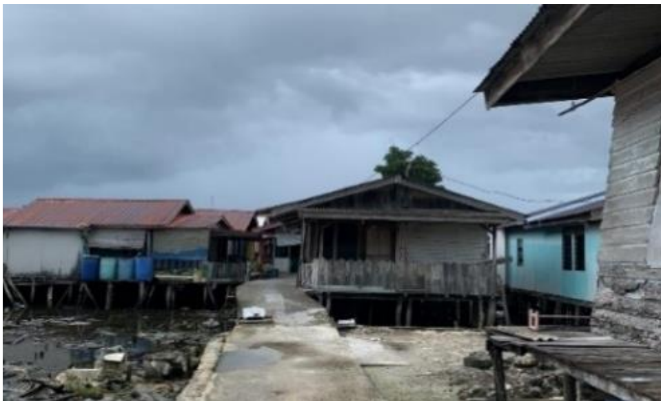
Sumber: Dokumentasi Penelitian (2022).

Pengamatan mengenai bangunan rumah akan memberikan informasi mengenai keadaan ekonomi dan pekerjaan warga yang ada di Kampung Tengah. Sehingga dapat menunjukkan tingkat kualitas sanitasi di Kampung Tengah masih rendah. Pada Gambar 2 . Dapat dilihat kondisi bangunan rumah warga.