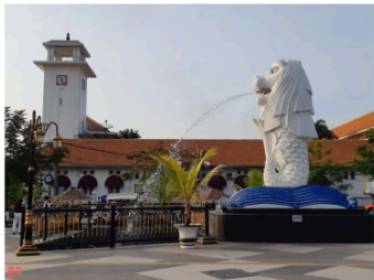
Gambar 1. Miniatur Patung Merlion di PSC Kota Madiun

Singapura, miniatur Kabah dari Mekkah, menara Eiffel dari Paris dan patung Liberty dari New York dibangun oleh Pemerintah Kota Madiun di sepanjang Jalan Pahlawan. Walaupun obyek wisata tersebut dapat menarik wisatawan untuk berkunjung, tetapi dapat berpengaruh terhadap karakter lokal Kota Madiun. Identitas kota, dapat terbentuk melalui pemahaman dan pemaknaan obyek fisik yang dapat berupa bangunan atau elemen fisik lain (Amar, 2009). Identitas kota seharusnya menjadi sebuah ciri khas, keunikan yang tidak dapat dijumpai di daerah lain. Sementara, Jalan Pahlawan menyimpan identitas sejarah Kota Madiun dengan adanya Gedung Balai Kota dan Bakorwil.