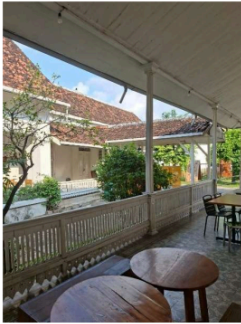
Gambar 2. Rumah Kapitan Cina

komunitas Tionghoa. Sekarang, bangunan ini telah dialih fungsikan menjadi sebuah kafe populer. Selain dapat menikmati makanan dan minuman yang tersedia, pengunjung juga dapat mengamati secara langsung arsitektur hasil akulturasi tiga budaya, Tionghoa, Belanda dan Jawa. Meskipun telah beralih fungsi, namun tidak merusak keaslian bangunan bersejarah tersebut. Sebab, terdapat beberapa bagian yang terbatas untuk pengunjung.