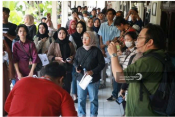
Gambar 3. Walking Heritage Tour

Di Kota Madiun terdapat komunitas bernama Historia Van Madioen atau Kompas Madya. Komunitas ini menyelenggarakan walking heritage tour , yaitu kegiatan berjalan kaki mengunjungi tempat bersejarah di Kota Madiun. Kegiatan ini sudah rutin dilakukan sejak tahun 2012. Walking heritage tour memiliki rute berbeda dalam setiap pelaksanaannya. Kegiatan ini dapat berdampak positif sebagai ajang promosi urban heritage tourism serta pelestarian nilai sejarah kepada wisatawan.