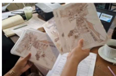
Gambar 4. UMKM Warga Foto Sketsah Wisata Peneleh

Pengembangan wisata heritage Kampung Peneleh telah membawa dampak ekonomi bagi masyarakat setempat, terutama melalui keterlibatan UMKM, penjualan produk lokal, dan jasa pemandu wisata. Kegiatan ini memunculkan peluang pendapatan tambahan bagi warga, walaupun sifatnya masih bergantung pada intensitas kunjungan dan penyelenggaraan event tertentu (Ratnawati & Prajitno, 2023).