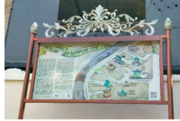
Gambar 2. Papan Informasi Peta Wisata Kampung Peneleh

Kampung Peneleh berada di kawasan padat penduduk dengan akses masuk melalui gang-gang sempit, sehingga kendaraan bermotor hanya dapat mencapai titik tertentu dan selebihnya pengunjung harus berjalan kaki. Kondisi ini justru memberi pengalaman khas wisata kampung, namun memerlukan penataan jalur pedestrian yang nyaman.