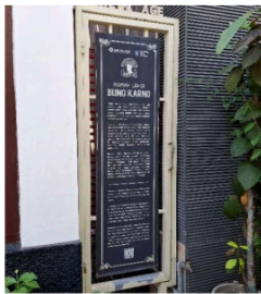
Gambar 3. Edukasi Rumah Kelahiran Bung Karno

terdapat papan informasi di beberapa titik, meski isinya belum seragam dari segi kedalaman materi. Edukasi untuk masyarakat lokal juga dilakukan melalui diskusi sejarah dan pelibatan warga sebagai narasumber.