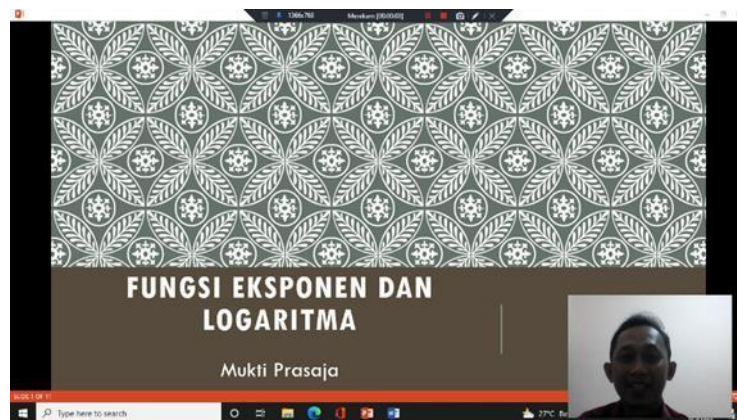
Gambar 4. Konsultasi dan Review