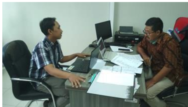
Gambar 1. Konsultasi dengan Ketua Jurusan dan Dosen Pengampu Mata Kuliah

Setelah berkonsultasi dan berkoordinasi dengan Ketua Jurusan dan Dosen Pengampu Mata kuliah, kegiatan berikutnya adalah menyiapkan referensi atau buku yang digunakan sebagai acuan dalam pembuatan video pembelajaran. Referensi atau bahan pembelajaran sangat penting dalam menyusun materi yang baik dan sesuai standar. Saat ini ketersediaan sumber belajar sebagai informasi tidak hanya berupa buku saja. Buku ajar